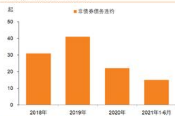
图 2：城投首次非标逾期违约统计