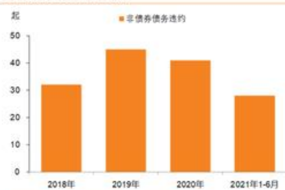
图 1：城投非标逾期违约统计