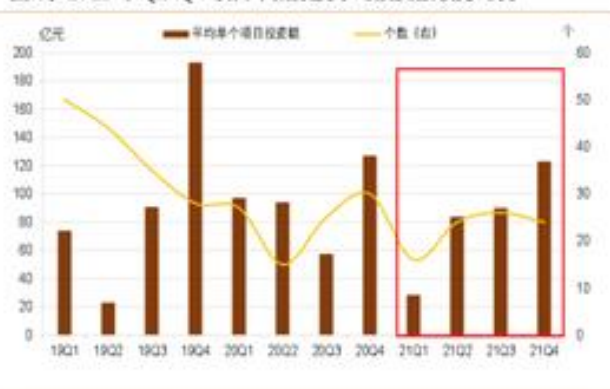
图 3: 2021 年 Q2-Q4 项目审批数及平均投资额较为均衡

从发改委近三年项目审批核准情况来看,2021 年发改委审批核准项目数 90 个, 合计规模 7754 亿元, Q2-Q4 审批核准项目数及平均项目规模较为均衡。从稳增长角度观察, 项目审批进度与规模仍然有待提升。