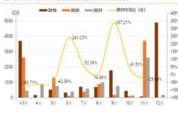
图 4: 2019-2021 年各月份发改委项目审批规模