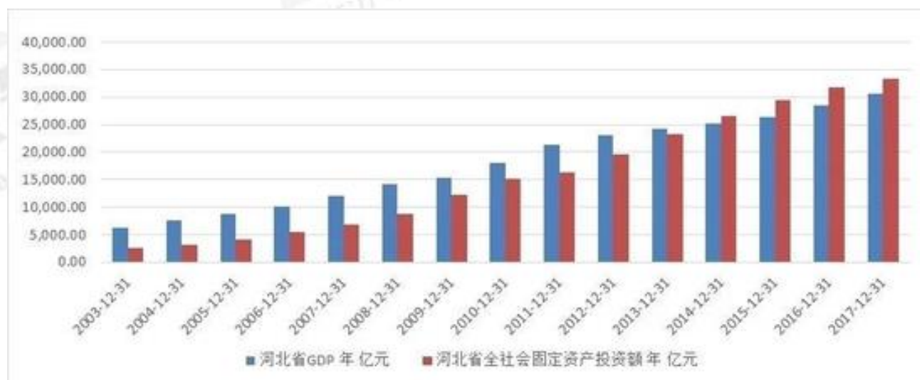
图 1 河北省全社会固定资产投资额与 GDP 总额对比