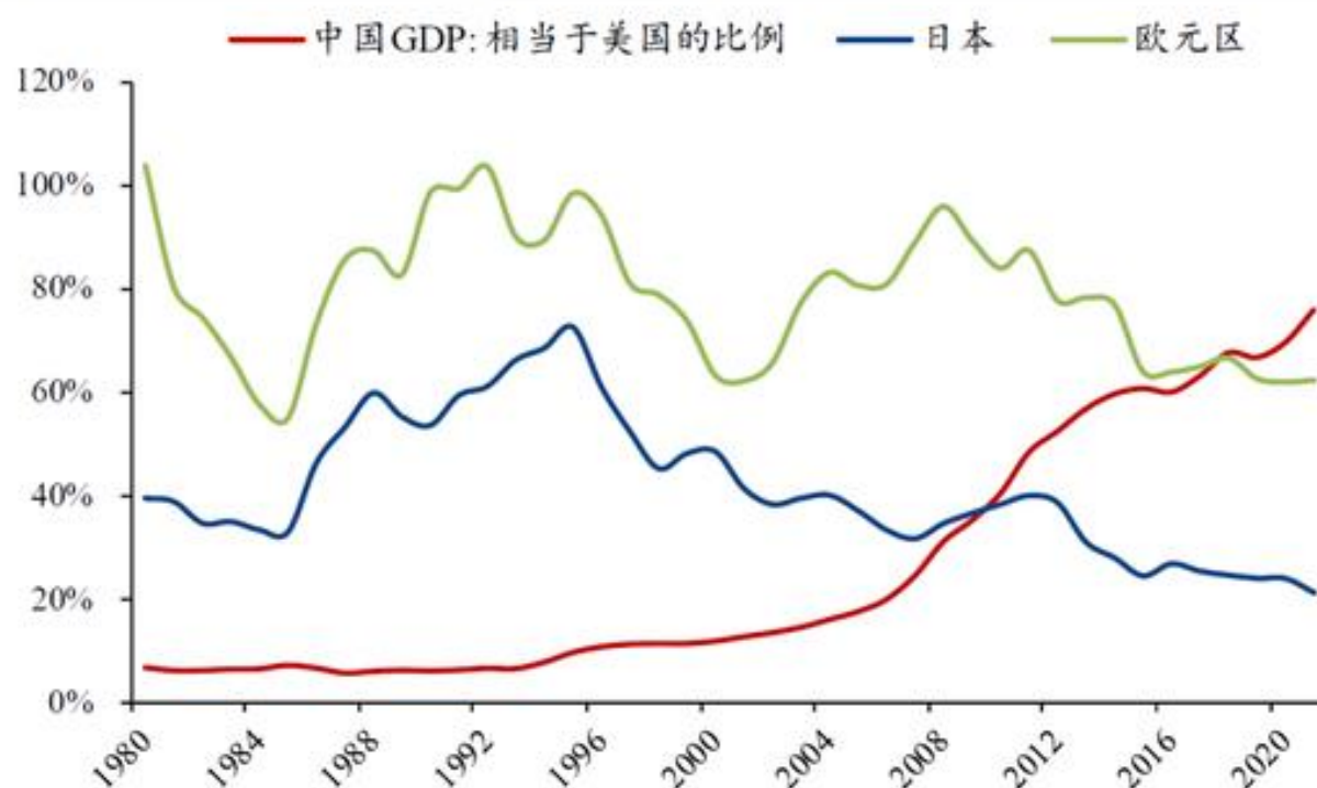
图表2：2022 年中国 GDP 总量相当于美国的 71%