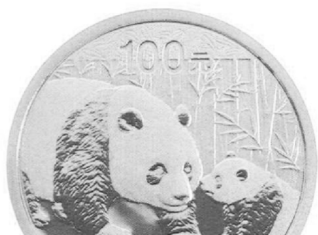
1/4盎司圆形金质纪念币正面图案