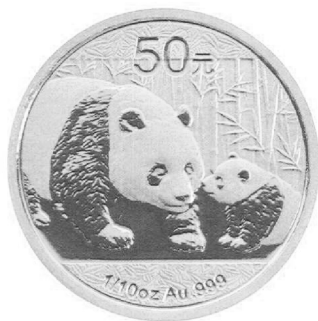
1/10盎司圆形金质纪念币正面图案