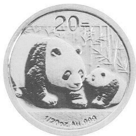
1/20盎司圆形金质纪念币正面图案