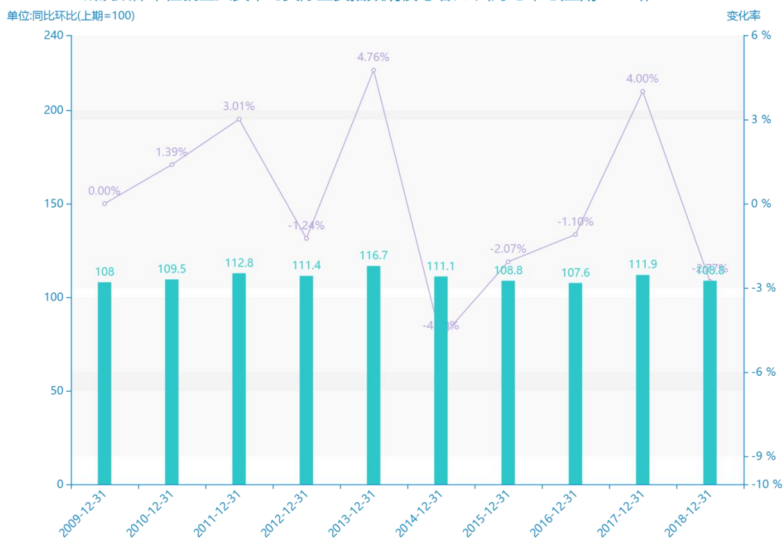
2009-2018城镇集体单位就业人员平均实际工资指数规模与增长率(同比环比)(上年=100) —○— 增长率