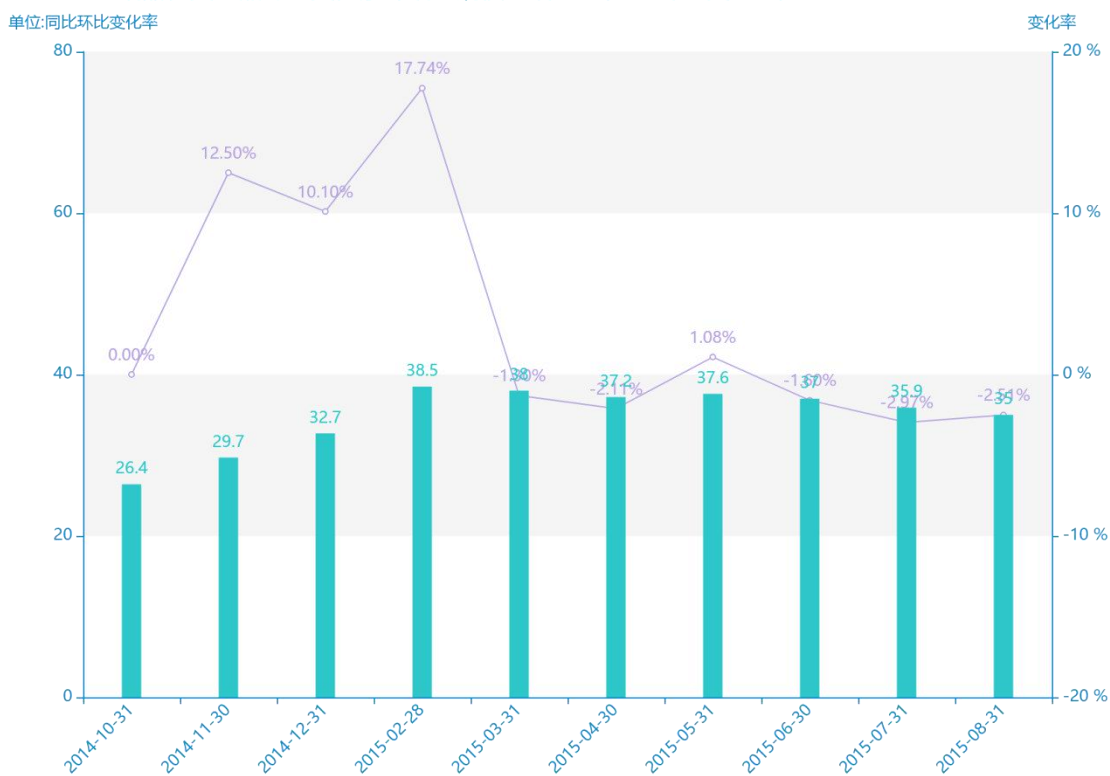
2014-2015通讯器材类商品零售类值累计增长规模与增长率(同比环比变化率) 通讯器材类商品零售类值累计增长(%) —○— 增长率

与历史数据相比，****通讯器材类商品零售类值累计增长为****同比环比变化率，该指标在****同期为****同比环比变化率，与****同期相比****了****同比环比变化率，同比****，****规模****，增长率较上一年度****%。****间，通讯器材类商品零售类值累计增长由****同比环比变化率变为****同比环比变化率，通讯器材类商品零售类值累计增长平均值为****同比环比变化率，平均增长率为****，****年增长最快，增长率为****；****年增长最慢，增长率为****。