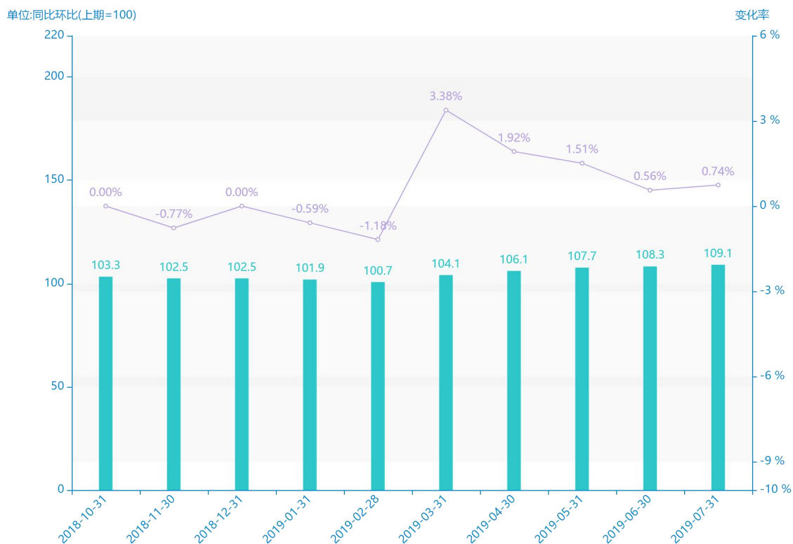
2018-2019食品类居民消费价格指数规模与增长率(同比环比(上期=100)) 食品类居民消费价格指数(上年同月=100) —○— 增长率