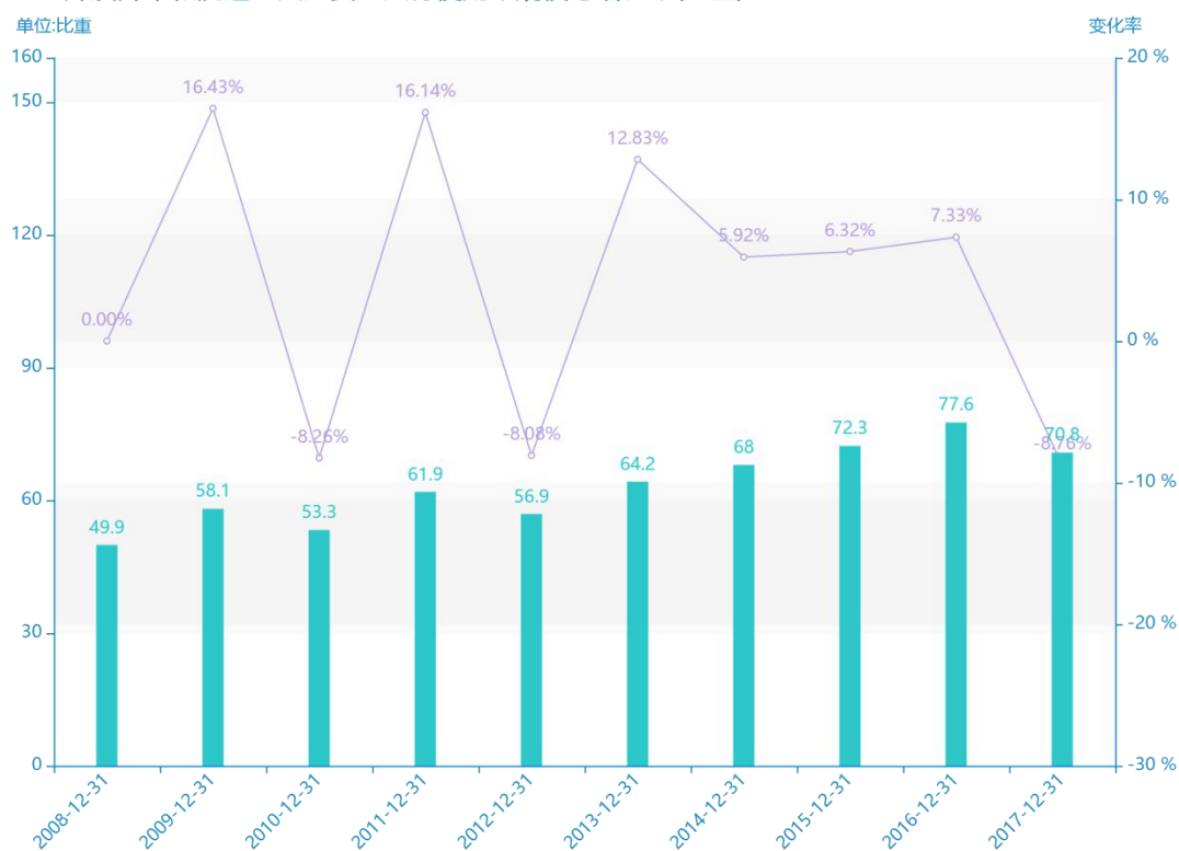
2008-2017煤炭开采和洗选业固定资产交付使用率规模与增长率(比重) ■ 煤炭开采和洗选业固定资产交付使用率(%) ○ 增长率

与历史数据相比，****煤炭开采和洗选业固定资产交付使用率为****比重，该指标在****同期为****比重，与****同期相比****了****比重，同比****，****规模****，增长率较上一年度****%。****间，煤炭开采和洗选业固定资产交付使用率由****比重变为****比重，煤炭开采和洗选业固定资产交付使用率平均值为****比重，平均增长率为****，****年增长最快，增长率为****；****年增长最慢，增长率为****。