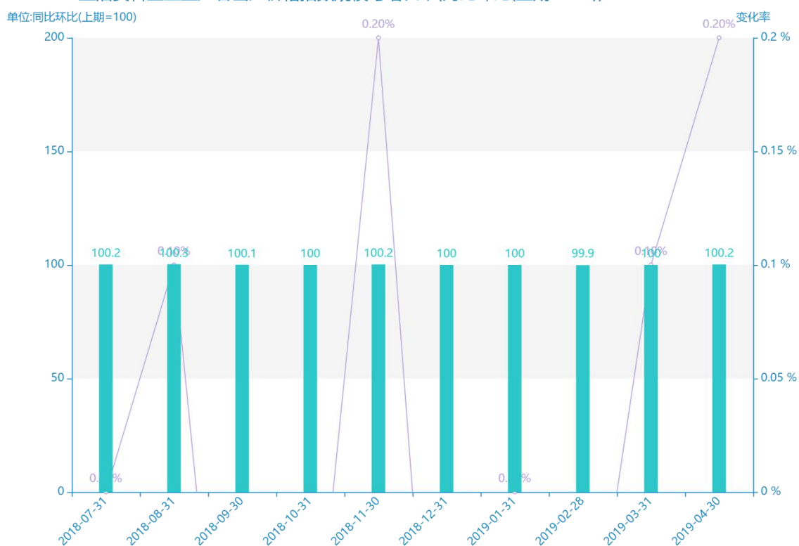
2018-2019生活资料工业生产者出厂价格指数规模与增长率(同比环比)(上期=100) 生产者出厂价格指数(上月=100) 增长率