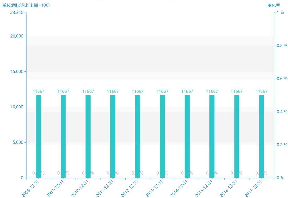
2008-2017第一产业增加值同比指数规模与增长率(同比环比(上期=100)) ■ 第一产业增加值同比指数(上年=100) ○ 增长率