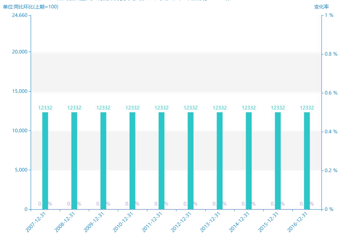
2007-2016第三产业增加值同比指数规模与增长率(同比环比(上期=100)) ■ 第三产业增加值同比指数(上年=100) ○ 增长率