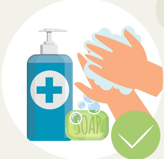
ລ້າງມືກ່ອນ ແລະ ຫຼັງຈາກ ທີ່ສຳຜັດກັບລູກນ້ອຍຂອງທ່ານ