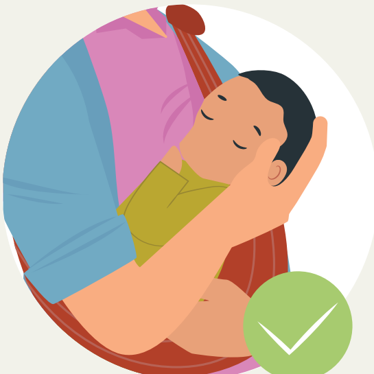
ໃຫ້ນົມລູກພຽງຢ່າງດຽວ ແລະ ຢ່າງປອດໄພ