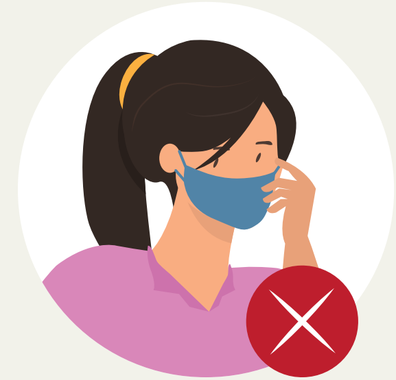
ຫຼີກລ່ຽງການສຳຜັດ ດວງຕາ, ດັງ ແລະ ປາກ