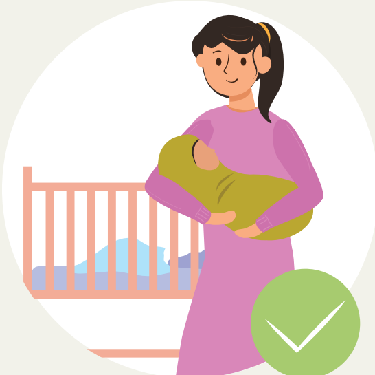
ຢູ່ຫ້ອງດຽວກັນກັບລູກ ທັນທີທີ່ລູກເກີດ