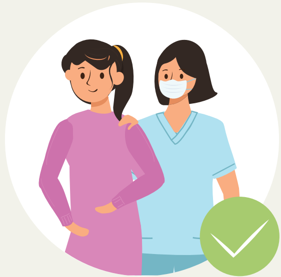
ການດູແລດ້ວຍຄວາມເຄົາລົບ ແລະ ໃຫ້ກຽດເຊິ່ງກັນ ແລະ ກັນ