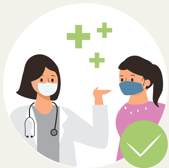
ໄດ້ຮັບຂໍ້ມູນທີ່ຈະແຈ້ງຈາກ ແພດໝໍທີ່ເບິ່ງແຍງແມ່ຖືພາ