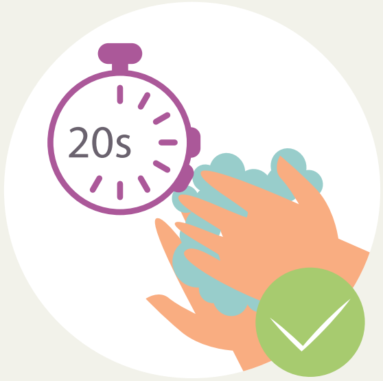
ລ້າງມືເປັນປະຈຳດ້ວຍ ສະບູ ແລະ ນໍ້າສະອາດ