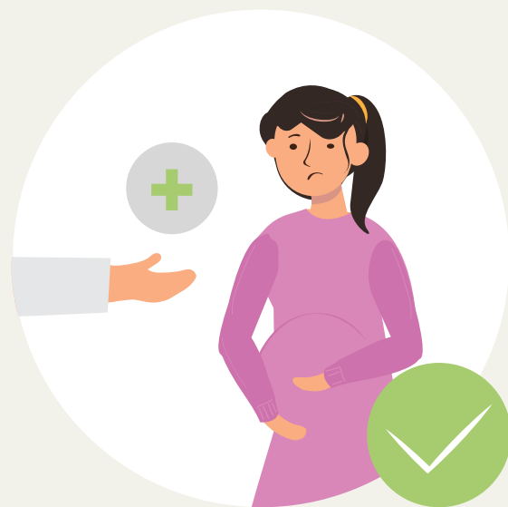
ຮູ້ວິທີປັນເທົາຄວາມເຈັບປວດ