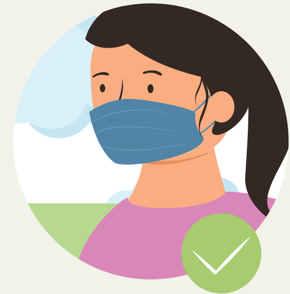
ສວມໃສ່ຜ້າອັດປາກ