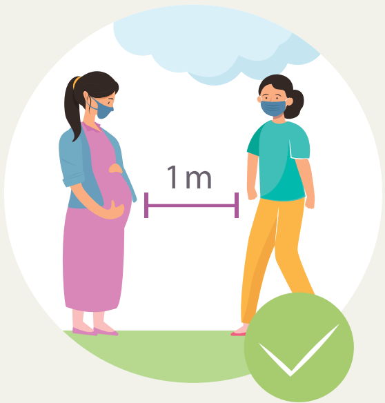
ເວັ້ນໄລຍະຫ່າງຢ່າງໜ້ອຍ 1 ແມັດ ຈາກຜູ້ອື່ນ