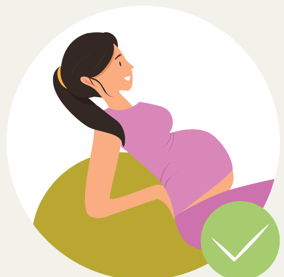
ການເກີດລູກອອກສະຖານທີ່ ບໍລິການສາທາລະນະສຸກ ອີງຕາມ ຄວາມເໝາະສົມ ແລະ ດ້ວຍຄວາມສະໝັກໃຈ