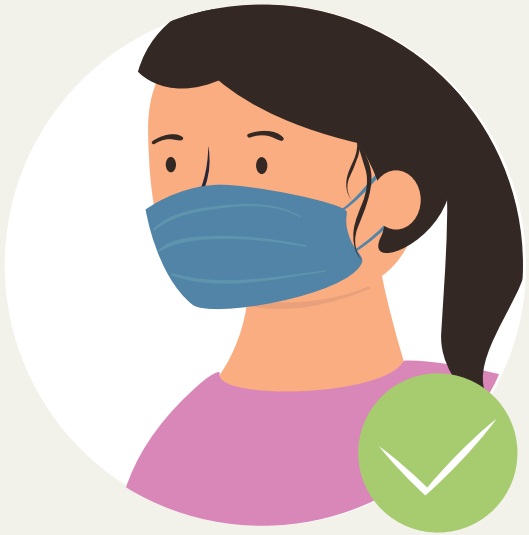
ສວມໃສ່ຜ້າອັດປາກ

ທ່ານສາມາດໃຫ້ນົມລູກໄດ້ - ໃຫ້ນົມທັນທີທີ່ເກີດ ຈະຊ່ວຍໃຫ້ ລູກຂອງທ່ານ ຈະເລີ່ມ ເຕີບໂຕໄດ້ໄວ. ແຕ່ທ່ານຕ້ອງ: