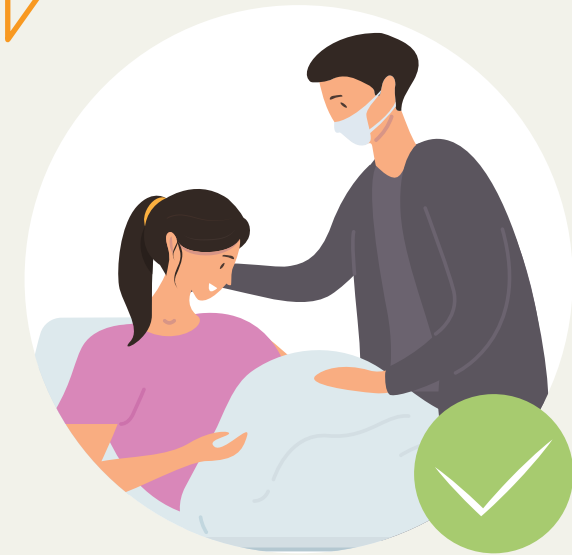
ຕົນເອງ ແລະ ສາມີ ໄດ້ຮັບຂໍ້ມູນທີ່ຈະແຈ້ງ