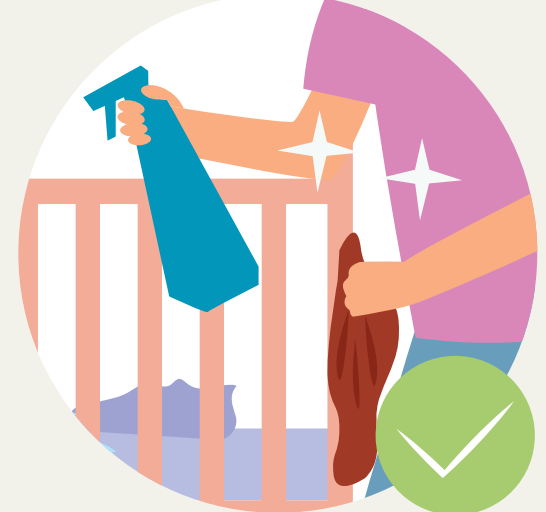
ທຳຄວາມສະອາດເພື່ອຂ້າເຊື້ອ ຕາມພື້ນຜິວຕ່າງໆເປັນປະຈຳ