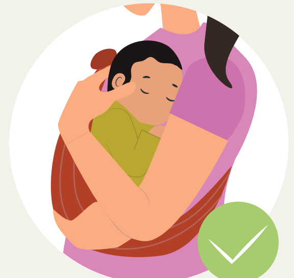
ກອດ ເພື່ອໃຫ້ລູກນ້ອຍໄດ້ໃກ້ຊິດ ແລະ ຮັບຄວາມອົບອຸ່ນຈາກແມ່