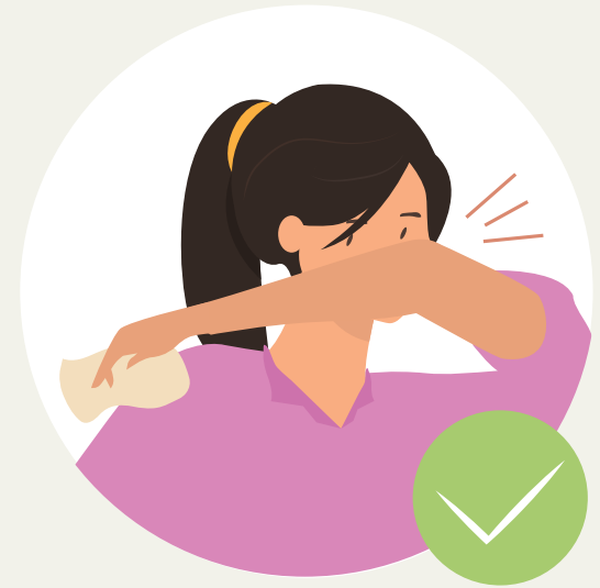
ໃຊ້ແຂນສອກ ຫຼື ໃຊ້ເຈ້ຍອະນາໄມ ອັດປາກ ແລະ ດັງ ໃນເວລາໄອ ຫຼື ຈາມ ແລະ ຖິ້ມເຈ້ຍອະນາໄມລົງຖັງຂີ້ເຫຍື້ອທັນທີ