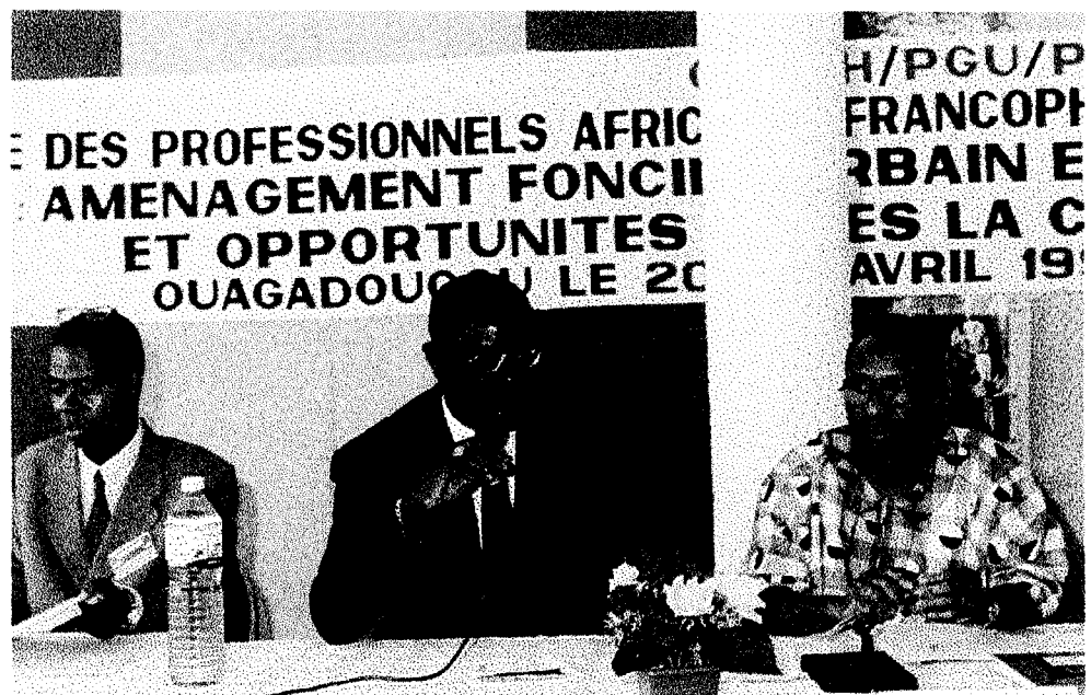
Colloque de Ouagadougou, 20-23 Avril 1999