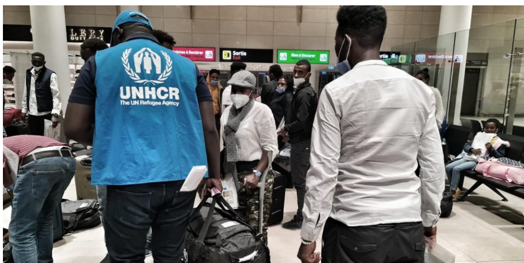
En décembre 2021, 19 réfugiés sont partis en vue de leur réinstallation dans des pays tiers, dont 10 évacués de Libye et 9 réfugiés enregistrés au Niger.