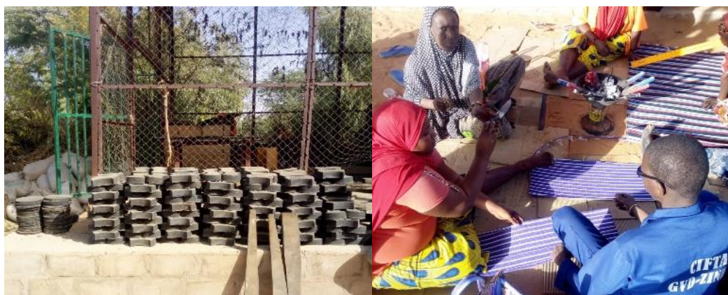
Dans la région de Tillabéri, les réfugiés utilisent des déchets solides pour fabriquer des briques et des paniers.

Dans le cadre du projet conjoint OIT/HCR , un centre de collecte et de tri des déchets domestiques et un atelier d'artisanat ont été mis en place en faveur des réfugiés et des membres de la communauté hôte à Ayorou. Grâce à ce projet, les réfugiés et les membres de la communauté hôte travaillent ensemble pour produire des briques et des paniers, entre autres articles.