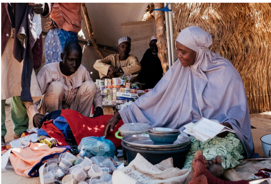
Ai, une réfugiée nigériane de 44 ans, veuve et mère de sept enfants, qui a fui une attaque de bandits dans son village du nord du Nigéria en 2019 puis relocalisée par le HCR dans le "village d'opportunité de Chadakori", a lancé un petit commerce qui l'aide à retrouver le sourire.

Pour des raisons de sécurité et pour faire face aux normes sphère, le HCR a relocalisé 3.972 ménages de 17.713 personnes loin de leurs premiers points d'entrée vers des villages sûrs et sécurisés où des services de protection sont disponibles. Ainsi, le HCR a relocalisé des réfugiés nigériens dans trois "villages d'opportunité". Il s'agit de 7.919 réfugiés à Chadakori : 5.434 à Dan Dadji Makaou et 4.360 à Garin Kaka. Mais une récente mesure des autorités régionales a suspendu le processus de relocalisation jusqu'à nouvel ordre.