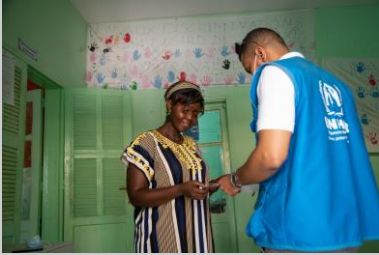
Mauritanie. Le HCR utilise des interventions en espèces par le biais de cartes prépayées dans les zones urbaines © UNHCR/Bechir Malum / 8 octobre 2021.

Le HCR est engagé à « rester et à agir » et fournit une protection et une assistance vitale aux réfugiés et aux demandeurs d'asile en ajustant son programme dans le cadre de la crise du COVID-19. Le HCR soutient le Gouvernement de Mauritanie dans la réponse à la pandémie de COVID-19. Pres de 17,700 réfugiés ont déjà été vaccinés dans le camp de réfugiés de Mbera (soit 25,8% de la population totale du camp) grâce à la mobilisation des réfugiés et à la bonne coordination entre les leaders communautaires, les partenaires humanitaires et le HCR. Le HCR a étendu ses interventions en espèces pour aider les réfugiés et les ménages vulnérables de la communauté d'accueil à surmonter la situation, aggravée par la perte de revenus. Grâce aux généreux dons des Etats-Unis (PMR) et à un projet mis en œuvre conjointement avec le G5 Sahel et la Banque Africaine de développement, le HCR a fourni des équipements médicaux , des articles médicaux , des ambulances et des formations médicales à plusieurs hôpitaux et structures de santé du pays.