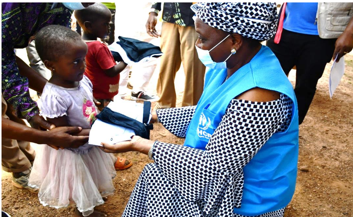
La cheffe de Sous Délégation du HCR Gbadolite remet symboliquement l'uniforme à une élève de première année de l'école Salongo 2 à Nzakara, province du Nord Ubangi.

En décembre, 5.005 réfugiés vivant au pôle de développement de Modale , dans la province du Nord Ubangi ont reçu une assistance alimentaire du PAM .