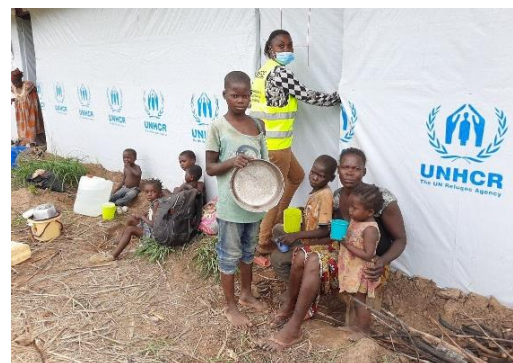
Une famille de réfugiés centrafricains devant son abri transitionnel au pôle de développement de WENZE, dans le Sud Ubangi