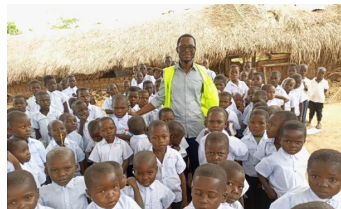
Le partenaire du HCR ADSSE distribue des fournitures scolaires et des uniformes aux élèves de 19 écoles dans la province du Nord Ubangi.