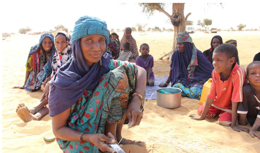
Un groupe de personnes déplacées internes dans la région de Tahoua.