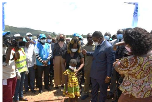
Le Premier Ministre Centrafricain, Henri Marie Dondra accueille une famille de réfugiés qui rentre en RCA au Port Amont, Bangui