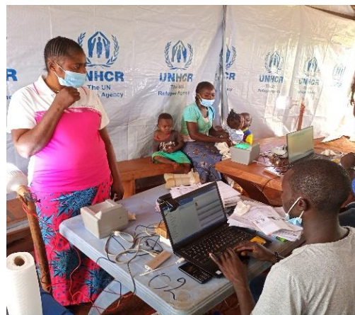
Des réfugiés centrafricains participent à un exercice de vérification physique dans le camp de Boyabu, province du Sud-Ubangi