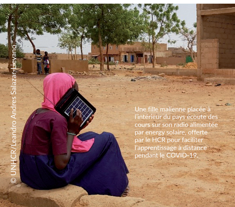
Une fille malienne placée à l'intérieur du pays écoute des cours sur son radio alimentée par energy solaire, offerte par le HCR pour faciliter l'apprentissage à distance pendant le COVID-19.

En tant que pays d'asile, le MALI a accueilli presque 48,000 réfugiés et demandeurs d'asile en provenance du Burkina Faso, du Niger et de la Mauritanie, dont 60% sont des enfants. Une augmentation significative de la population réfugiée a été constatée ces derniers mois, principalement dans les zones frontalières du nord et du centre du Mali, suite à la détérioration de la situation sécuritaire au Burkina Faso et au Niger voisins. En outre, le Mali compte également près de 350,000 personnes déplacées à l'intérieur du pays. De nombreux enfants et jeunes n'ont pas accès aux projets d'intégration parrainés par le gouvernement en raison de plusieurs facteurs, notamment les problèmes d'identification des besoins individuels, l'éloignement des lieux de retour et l'accent mis sur l'assistance de groupe. Ces enfants et ces jeunes à risque se résolvent souvent à retourner sur les routes migratoires à la recherche d'opportunités, car les réseaux de contrebande entre la capitale et les régions frontalières du nord du pays sont très répandus. Les enfants non accompagnés ou orphelins sont particulièrement vulnérables à la traite et à l'exploitation, notamment l'exploitation sexuelle, la mendicité forcée, le colportage de marchandises dans les rues et d'autres formes dangereuses de travail des enfants.