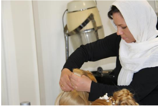
پناهندگان جوان افغانستانی از طریق دوره های آموزشی فنی و حرفه ای در ایران، مهارت های قابل عرضه در بازار و مورد تقاضا را کسب می کنند.

طبق برآوردهای انجام شده حدود ۱,۵-۲ میلیون نفر افغانستانی فاقد مدرک در ایران زندگی می کنند. دولت ایران در سال ۲۰۱۷ میلادی برای بیش از ۸۰۴,۰۰۰ نفر فاقد مدرک ۱ (اغلب افغانستانی) که در طرح سرشماری شرکت کرده بودند، برگه ی سرشماری صادر کرده است. افرادی که در این سرشماری شرکت کردند ساکن ایران بوده ولی فاقد کارت آمایش معتبر، پاسپورت افغانستانی با ویزای ایران هستند. نوع مدارکی که قرار است برای شهروندان افغانستانی که در طرح های سرشماری شرکت کرده اند صادر شود در دست مذاکره است. در نوامبر ۲۰۱۸ میلادی، دولت طرح سرشماری جدیدی اینبار از اتباع خارجی که به صورت رسمی و یا غیررسمی در ایران مشغول به کار هستند و کارفرمایان آنها را آغاز کرده است. کمیساریا برای پیگیری این مسئله به طور مداوم با طرفین ذیربط در ارتباط است.