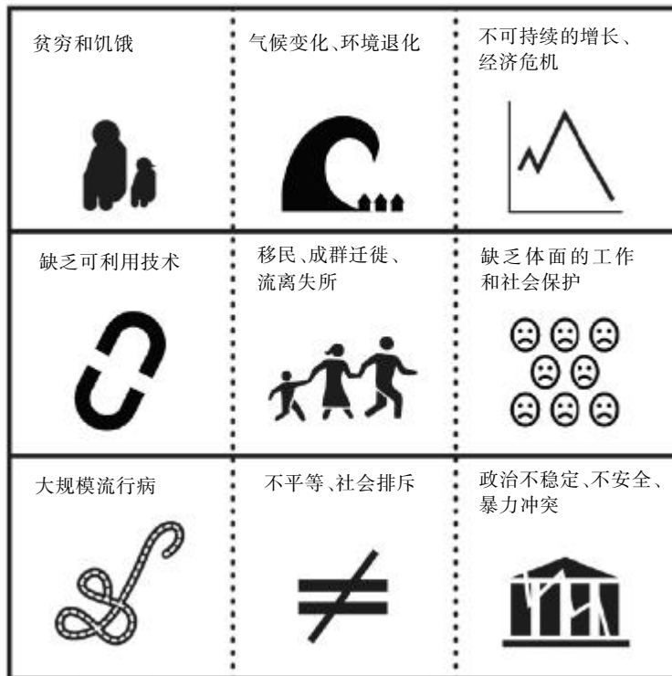
图2 我们时代的全球性挑战

在本报告中,联合国社会发展研究所仔细观察了一些创新和改革的关键领域。同时,对于在特定背景下(尤其是在发展中国家)到底是什么东西正在对转型性变革起作用,本报告也作了考察,并确定了挑战和可能存在的矛盾。报告分析了哪些政策和研究方法有可能对可持续发展目标的实现起作用,探索了让政策具有连贯一致性的方式,以及为此所需要的民主的、参与性的政策流程和制度(图3)。